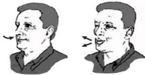
Hít vào thật sâu, từ từ bằng mũi