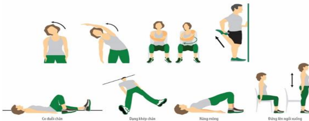
Co duỗi chân